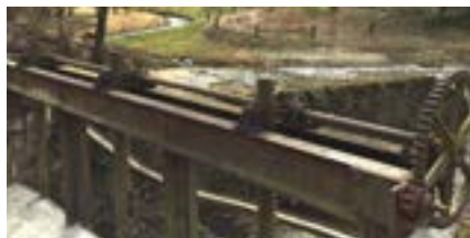
8 Confluence 45.96983,4.79182