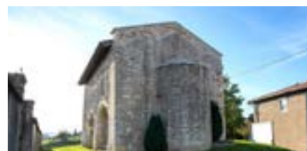
9 Chapelle du vieux bourg 45.961170, 4.774820