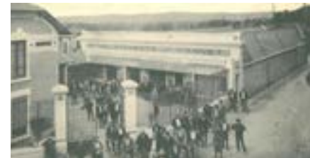
12 Entreprise Vianney 45.94201,4.77069