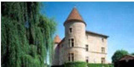
10 Château de Tanay 45.95636,4.77321