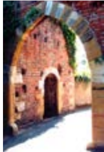
11 Porte de Villars 45.94245,4.77605