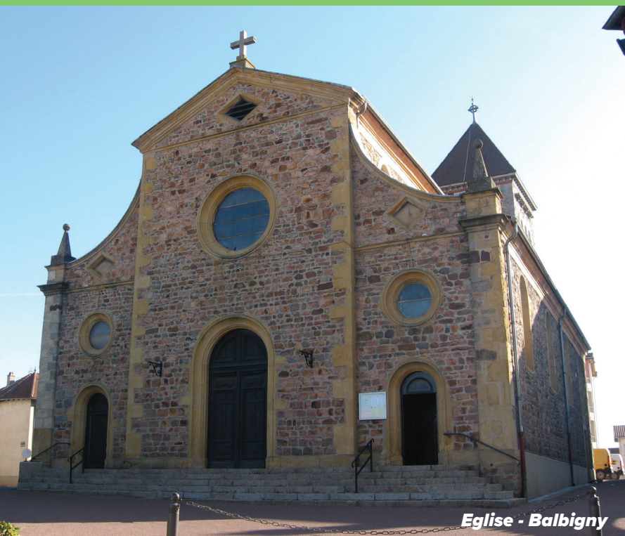
Eglise - Balbigny