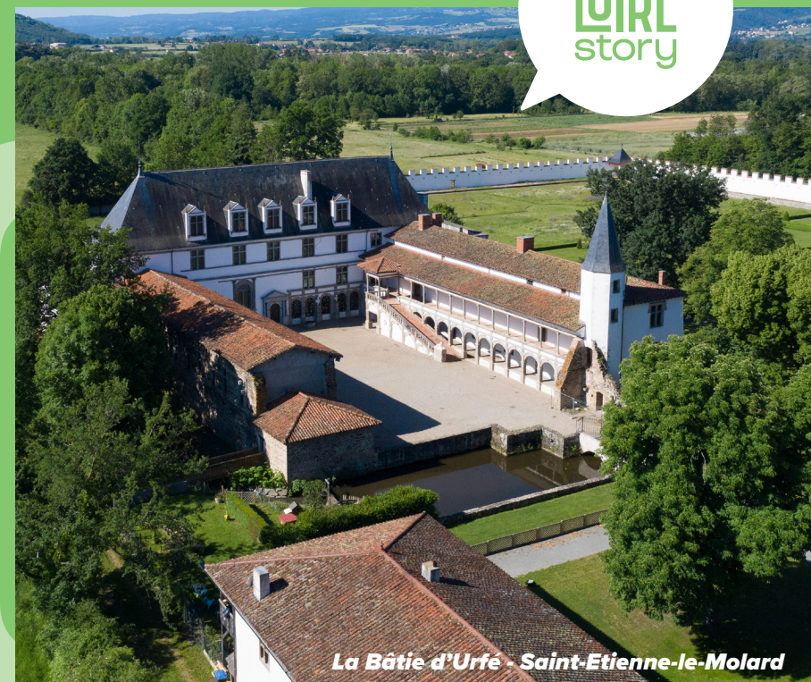
La Bâtie d'Urfé - Saint-Etienne-le-Molard