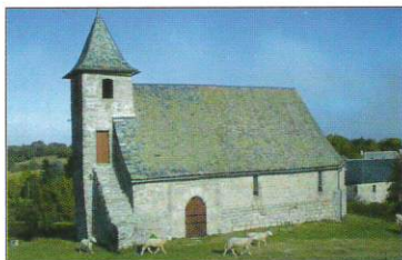
La chapelle de Lagarde

Rendu aux habitants à la révolution, de nos jours, il ne reste plus que quelques ruines de cet édifice, seule la chapelle fut sauvée. Restaurée, et mise en valeur par la commune de Lieutadès, elle est un témoignage d'un très grand intérêt non seulement pour l'histoire locale mais aussi pour celle du Temple en général.