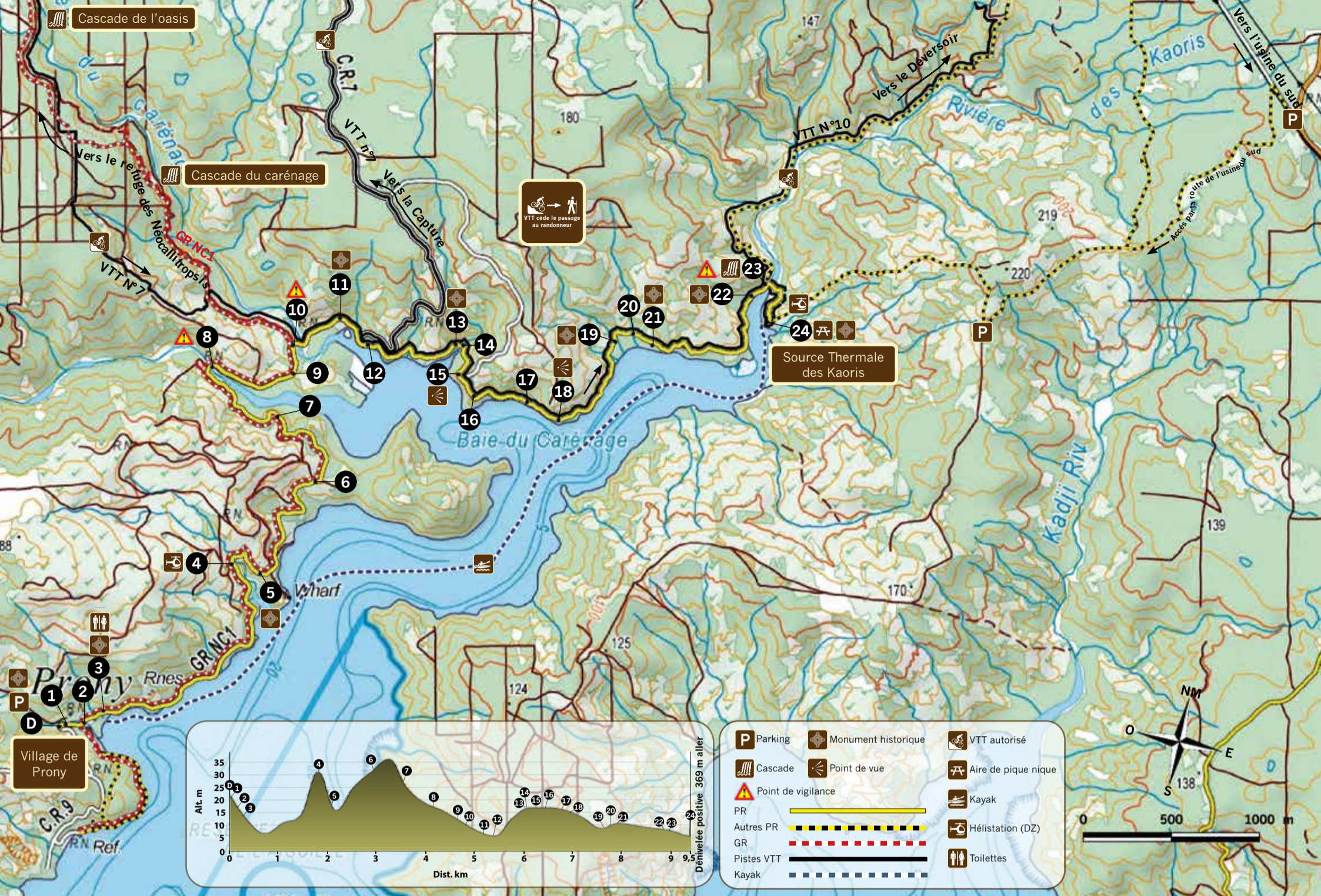
Données géographiques gouvernement de la Nouvelle-Calédonie · Carte ExploreNC