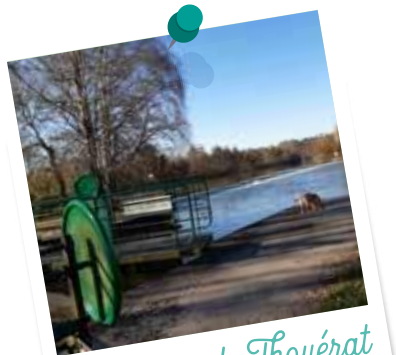
L'écluse de Thouérat

11 - Quitter le chemin pour prendre le petit sentier à gauche qui descend dans le bois. À la sortie du bois, longer le champ vers la droite pour remonter à droite dans le sous-bois.