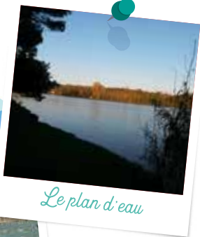
Le plan d'eau