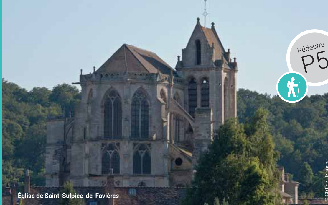
Église de Saint-Sulpice-de-Favières