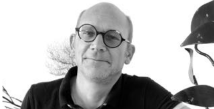
Emmanuel de Cockborne Sculpteur métal http://emmanueldecockborne.art/