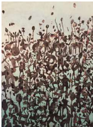
©France Gaillet, De l'autre côté du miroir, 2019, acrylique sur toile, 130x97 cm