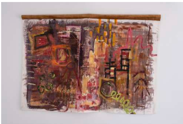
©Marion Detalle, Citadine frénésie, 2023, toile sur tissu coton avec contour velours et peinture acrylique, 145 x 98 cm