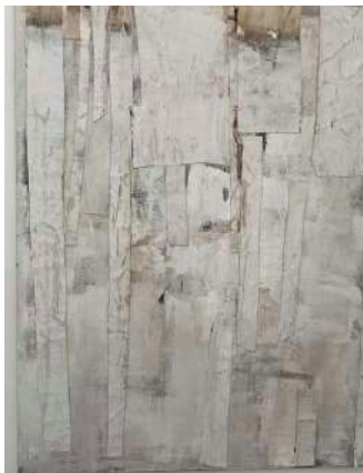
©Sophie Llopiz, L'écorce, 2022, pièces découpées en toile de jute, peintes à l'acrylique, collées sur toile peinte d'acrylique et de plâtre, 124x95 cm