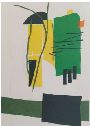
©Danielle Ubéda, série Ottonel 4/4, 2021, papiers découpés, 50 x 65 cm