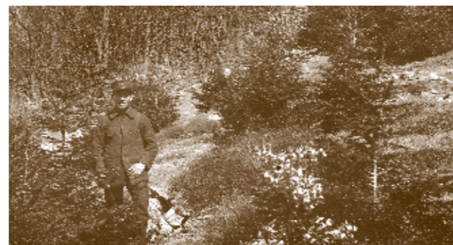
Jeunes sapins plantés dans une clairière, 1923

Au cours des siècles précédents, ce versant sud de la montagne d’Aulas a été défriché pour servir de pâturage. Les pentes, envahies par les genêts, furent ensuite livrées aux écobuages et à l’érosion. Ces pratiques ont ruiné le sol, laissant par endroit la roche à nu. À la fin du XIX e siècle, les forestiers ont planté sur ces pentes des épicéas. Ces arbres pionniers ont petit à petit reconstitué un sol forestier et, sous leur ombre, des sapins ont été plantés, des graines de hêtres sont venues germer.