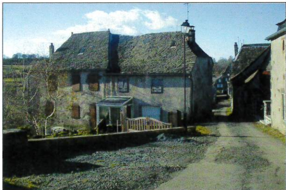
Maison du village d'Espinasse

De nos jours, bon nombre de villages du Cantal, Lozère et Aveyron possèdent leur amicale des auvergnats de Paris qui se retrouvent chaque été au pays, organisant des rassemblements où souvenirs et convivialité sont souvent partagés autour d'un traditionnel aligot accompagné de quelques notes d'accordéon.