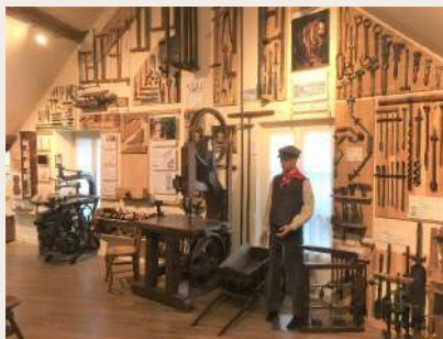
Le Musée de l'outil