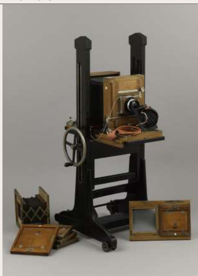
Chambre d'atelier Globus K 18x24 - v. 1895