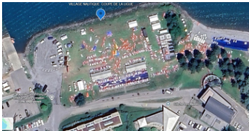
Village du Championnat d'Europe IQfoil 2024

Le village, installé près des zones de course, est le cœur convivial de l'événement. Centre névralgique, il regroupe accueils, stands partenaires et espaces d'information pour participants, familles et visiteurs.