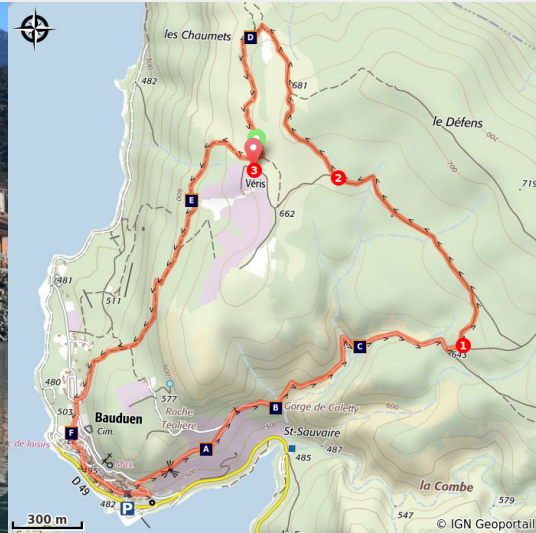
Un village les pieds dans l'eau

Le sentier de Véris pourrait se nommer le sentier des sens, tant vos yeux et votre odorat vont être mis à rude épreuve.