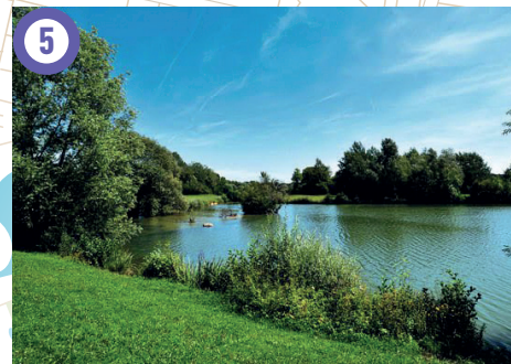
Ile de loisirs du Port aux Cerises, Draveil et Vigneux-sur-Seine 200 hectares de plaines, bois et étangs. (voir descriptif des activités sur : https://le-port-aux-cerises.iledeloisirs.fr )