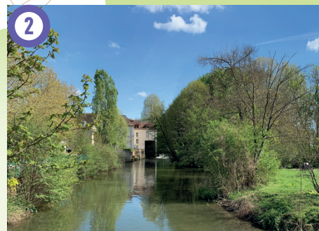
Bords de l'Yerres, Crosne Située à quelques encablures de l'avenue Jean Jaurès, artère principale de Crosne, l'île aux Prévost s'étend sur plus de 7 hectares. Hâvre de quiétude, ce lieu abrite, entre autres, sureaux, églantiers, frênes, érables, ronciers, orties... et laisse une biodiversité s'épanouir.