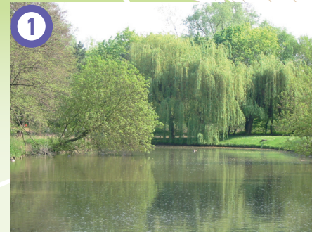
Parc Reigate et Banstead, Brunoy (Voir le descriptif dans le circuit Boucle Découverte)