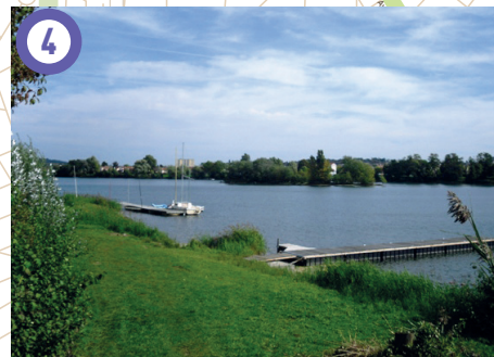
Lac Montalbot, Vigneux-sur-Seine (Descriptif, voir circuit Sport et Nature). Le lac se contourne sur les faces Sud et Sud Est sur environ 1,2km.