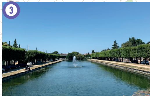
Lac Frayé, Vigneux-sur-Seine Ce lac est une pièce d'eau oblongue, aménagée en forme de clé dans les années 1760-1780 au cœur du Domaine Château-Frayé avec, au centre de sa partie circulaire, un îlot qui accueille canards et autres volatiles.