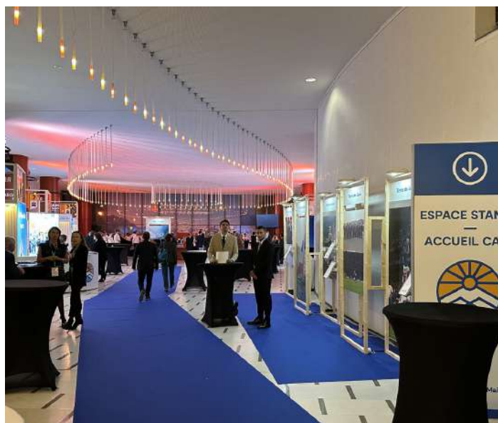
Stands dans le Hall