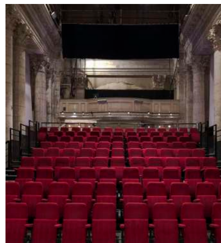
THÉÂTRE DES BERNARDINES MARSEILLE