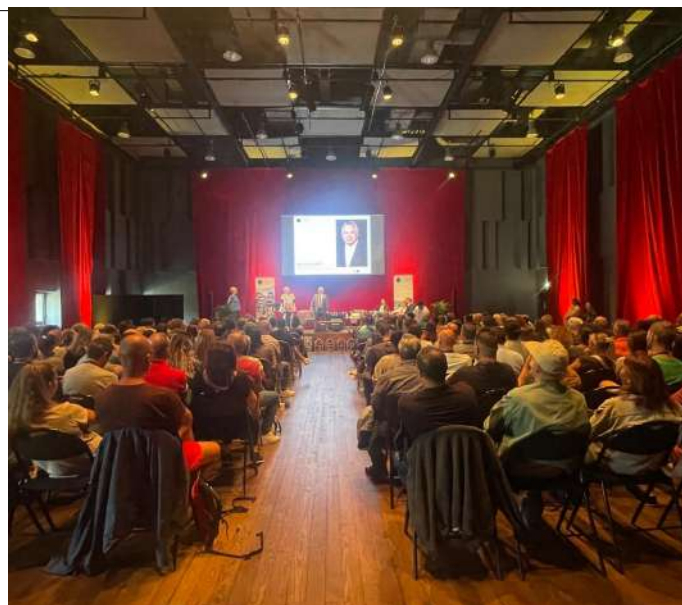
Séminaire au Studio Big One