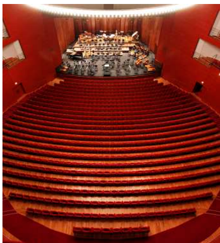
GRAND THÉÂTRE DE PROVENCE AIX-EN-PROVENCE