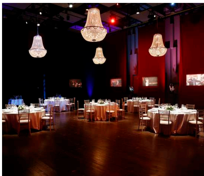
Dîner de gala au Studio Big One