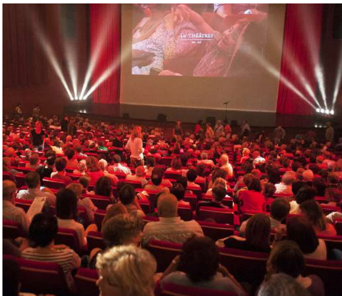
Conférence en Salle de spectacle