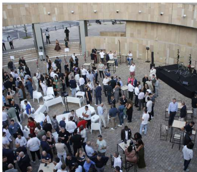
Cocktail dans le Patio