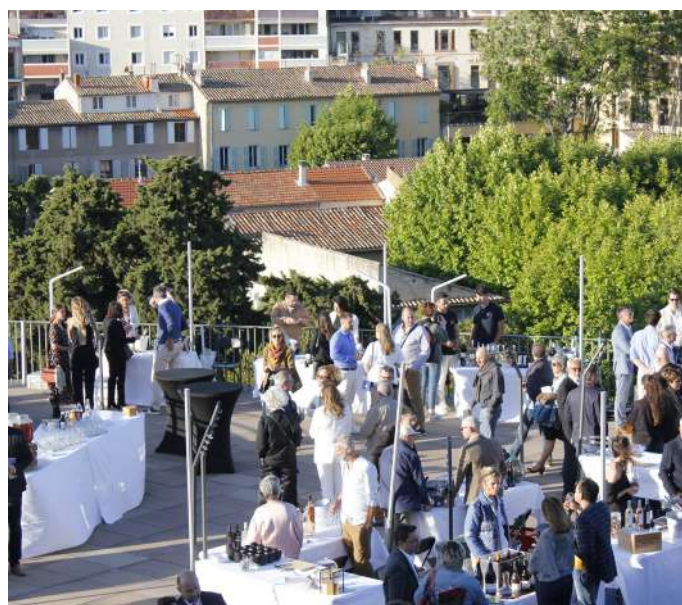
Cocktail sur les Terrasses