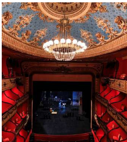
THÉÂTRE DU JEU DE PAUME AIX-EN-PROVENCE