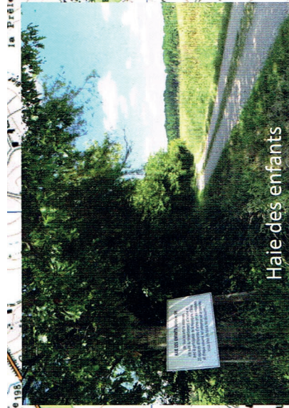
Haie des enfants