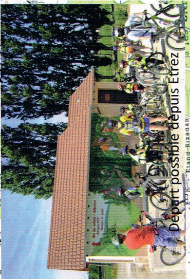
Départ possible depuis Etrez