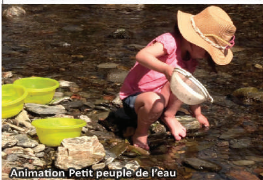
Animation Petit peuple de l'eau