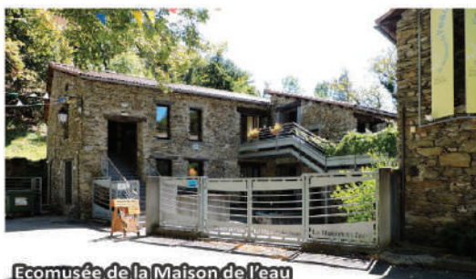
Ecomusée de la Maison de l'eau