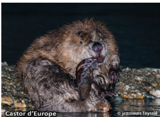
Castor d'Europe © Jeanlouis Teyssié