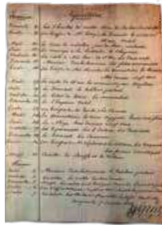
Programme d'ouverture de l'Opéra en 1826

Avec son Chœur, son Ballet et sa Maîtrise, accompagnés par l'Orchestre national Avignon-Provence, l'Opéra Grand Avignon porte une programmation exigeante, ouverte et accessible, mêlant redécouvertes d'œuvres, créations contemporaines, et actions de médiation.