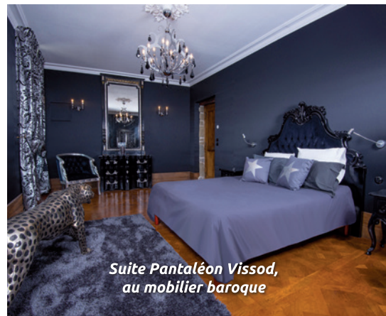
Suite Pantaléon Vissod, au mobilier baroque