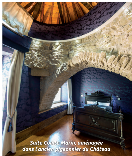
Suite Comte Marin, aménagée dans l'ancien pigeonnier du Château