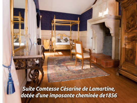
Suite Comtesse Césarine de Lamartine, dotée d'une imposante cheminée de 1856

Au sommet de la majestueuse montée d'escaliers, le Château de Servolex prolonge l'enchantement... Spacieuses et feutrées, toutes les Suites offrent un espace précieux et personnalisé. Décorées avec un soin extrême, elles enchanteront vos nuits dans un confort absolu.