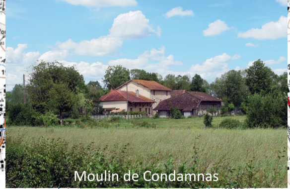
Moulin de Condamnas

CARTE IGN 1 : 25 000 N° 31280 © IGN -2014 - Autorisation n° 5014-113 Reproduction interdite