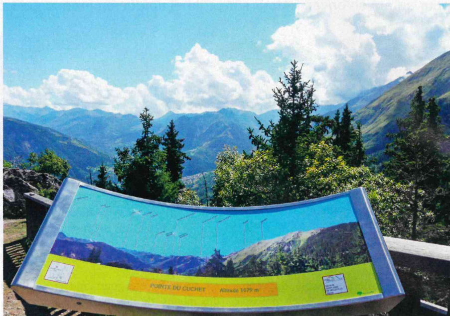
Une table d'orientation vous indique les différents sommets visibles.

La balade offre également de magnifiques points de vue depuis deux belvé-