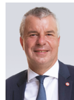
Martial Saddier Président du Conseil départemental de la Haute-Savoie

5 et 6 avril : Week-end d'ouverture de l'exposition Plus d'infos en pages 5 et 7