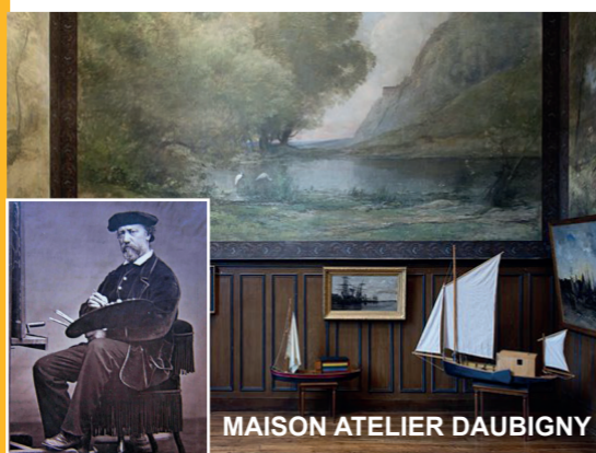
MAISON ATELIER DAUBIGNY

• Samedi et dimanche | Saturday and sunday