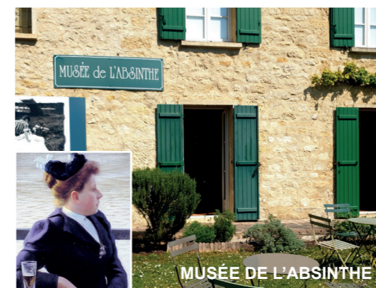
MUSÉE DE L'ABSINTHE