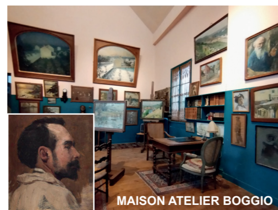
MAISON ATELIER BOGGIO