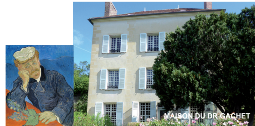
MAISON DU DR. GACHET

• Samedi et dimanche | Saturday and sunday