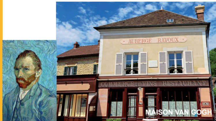
MAISON VAN GOGH

• Du mercredi au dimanche | from wednesday to sunday