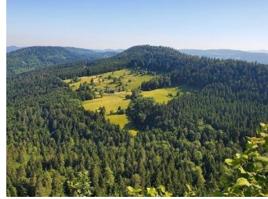
Panorama depuis Planachat