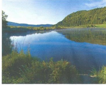
L'étang des Lésines