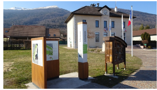
départ devant la mairie

Point d'arrivée de l'activité Parkings école/mairie d'Echenevex