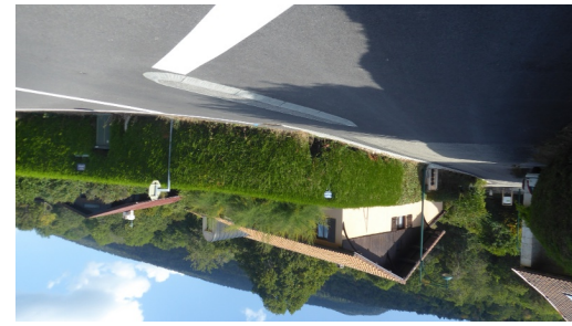
ici, prendre la rue du Pied du Mont