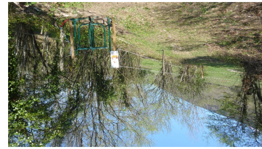
empruntez le tourniquet et traversez le champs