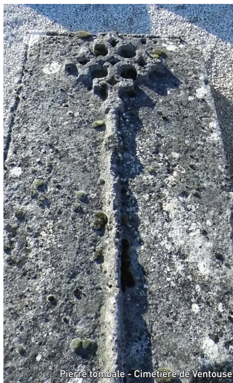
Pierre tombale - Cimetière de Ventouse