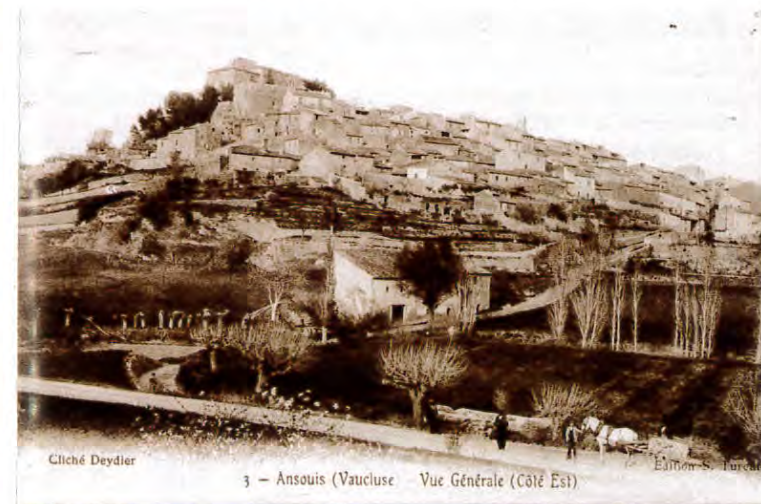
3 - Ansouis (Vaucluse - Vue Générale (Côté Est)

Itinéraire d'un curieux à la rencontre des temps anciens