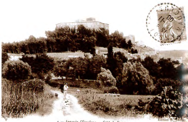
4 - Ansouis (Vaucluse - Côté de France

Le recensement de 1901 dénombrait 645 habitants à Ansouis ; depuis 1856 et ses 991 habitants, la décroissance est régulière et forte (960 hab. en 1866, 886 hab. en 1876), due essentiellement à la crise agricole qui sévit durement. La population atteindra son point le plus bas en 1962 (520 habitants). Aujourd'hui, de nouveaux pôles d'intérêt (tourisme, secteur tertiaire) et le développement des transports ont permis le "repeuplement" d'Ansouis qui compte à présent 1102 habitants.