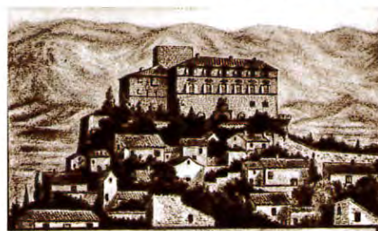
CHATEAU D'ANSOUIE. (V. VAUCLUSE.)

Les vues d'Ansouis sont reproduites sur des toiles et ont été mises en situation à des hauteurs diverses : l'itinéraire vous conduit à partir du Boulevard des Platanes (photos 1 et 2) jusqu'à la Place de l'Église (photo 6) en passant par la Place des Hôtes (photo 3), la Rue du Petit Portail (photo 4) et la Place du Château (photo 5). Bonne découverte.