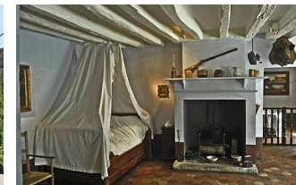
Musée des peintres de Barbizon

Période d'ouverture : Du 02/01 au 20/12. Fermé le mardi. Fermeture exceptionnelle le 1er mai. Horaires : 10h - 12h30 / 14h - 17h30 Horaires juillet et août : 10h - 12h30 / 14h - 18h Fermé le 1er mai.