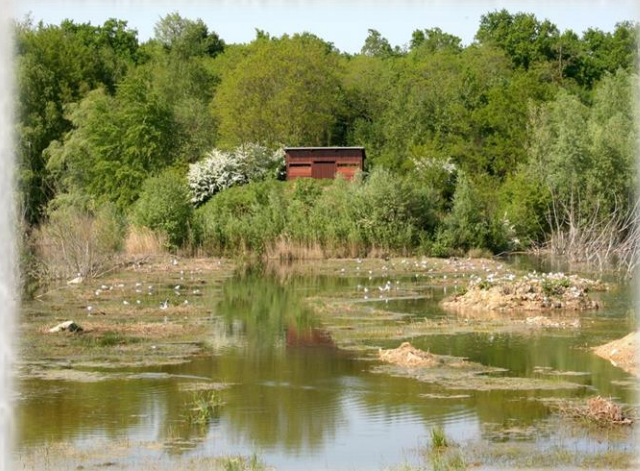
Photo : L'observatoire, réserve du Grand-Voyeux © OT du Pays de l'Ourcq.

Installé sur le site d'anciennes extractions de sable et gravier, le domaine régional du Grand Voyeux est un paradis pour la faune et la flore. D'une superficie de 242 hectares, la réserve accueille les oiseaux sédentaires et migrateurs liés aux zones humides. Grèbe huppé, petit gravelot ou busard des roseaux font partie des espèces que l'on peut apercevoir des deux observatoires installés sur place. Partenaires du projet, l'Agence des Espaces Verts d'Ile de France, le Conseil Général, la commune de Congis-sur-Thérouanne et la Communauté de Communes du Pays de l'Ourcq ont confié l'animation du site à l'association pour la valorisation des Espaces Nature du Grand Voyeux (AVENT) - Visite sur rendez-vous.