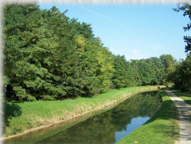
Le Canal de l'Ourcq.