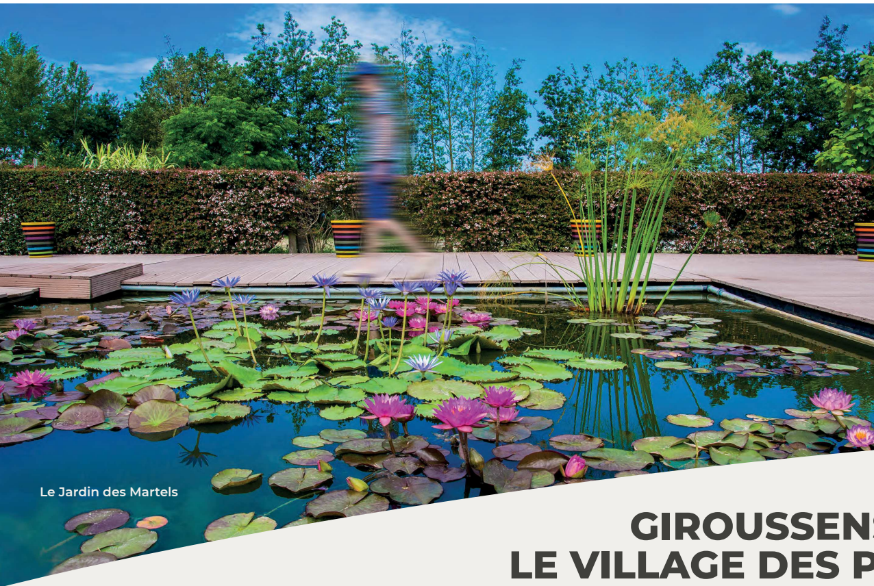
Le Jardin des Martels