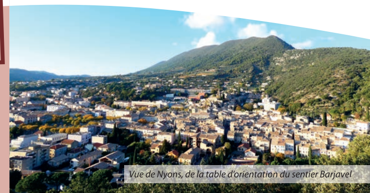
Vue de Nyons, de la table d'orientation du sentier Barjavel

Livret des sentiers «Découverte de Nyons et des environs», disponible en Mairie et à l'Office de Tourisme des Baronniees en Drôme Provençale.