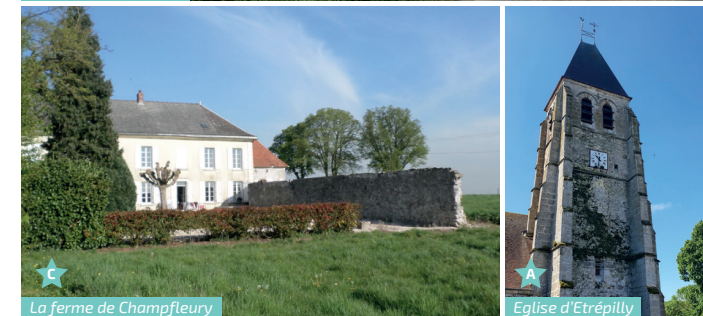
La ferme de Champfleury