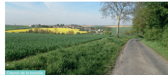
Chemin de la bataille