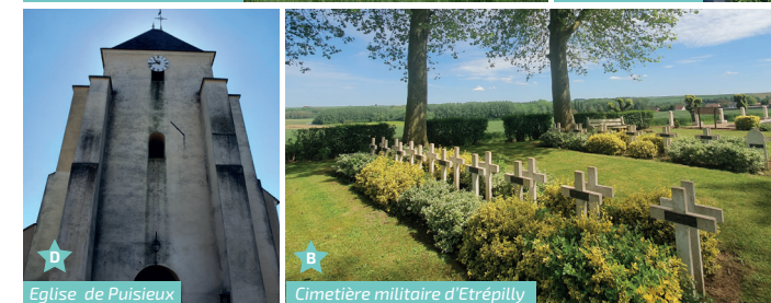
Eglise de Puisieux