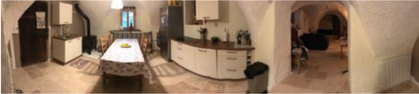
RDC - Cuisine