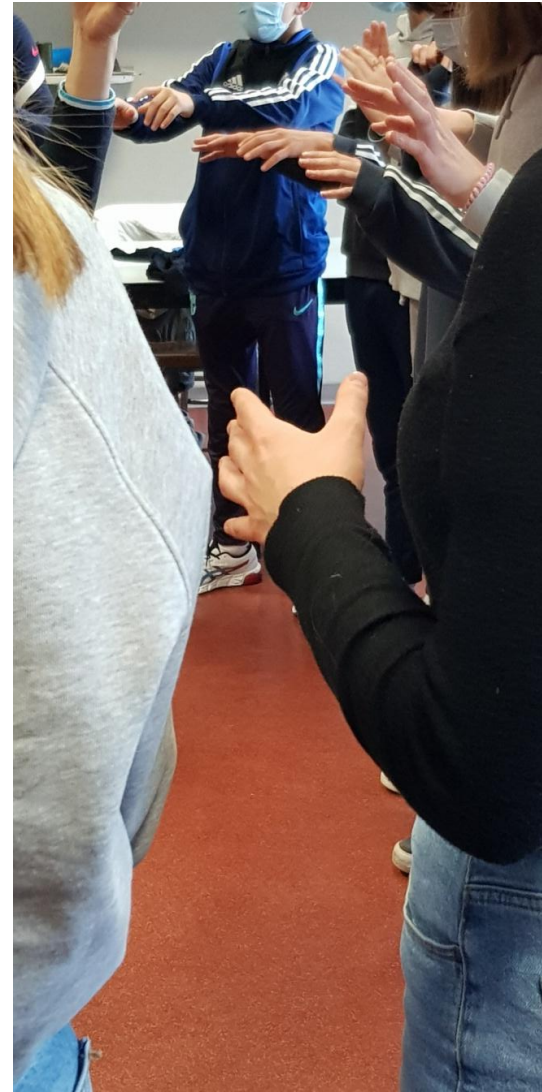
Ateliers et expérimentations sonores