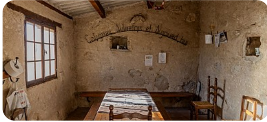
© F. Galile - Provence Verte & Verdon