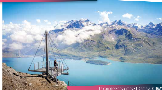
La canopée des cîmes

La descente sur le domaine skiable vous laisse imaginer les grands espaces hivernaux. Tant de pierres en été pour tant de neige en hiver... Pas de doute, c'est la magie des grands espaces de Haute Maurienne Vanoise