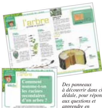
Des panneaux à découvrir dans chaque dédale, pour répondre aux questions et apprendre en s'amusant !

Une aventure ludique à vivre dans un vaste labyrinthe divisé en plusieurs dédales séparés par des portes fermées. A chaque étape vous devez répondre à des questions et des épreuves afin de trouver les mots de passe nécessaires pour accéder au dédale suivant.