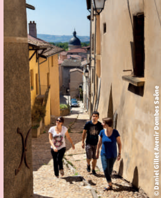
Rue Casse-cou 7