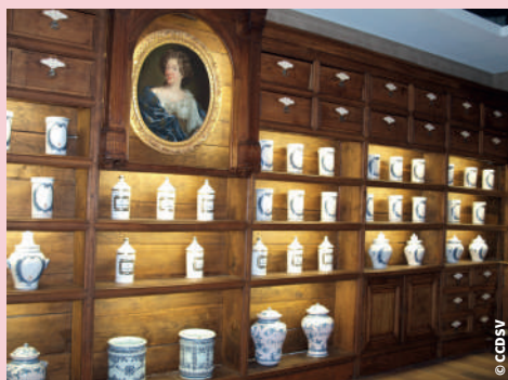
Carré Patrimoines - La Passerelle 4