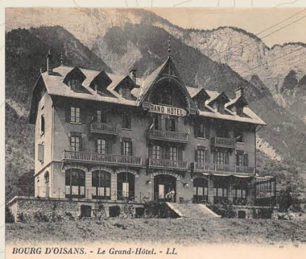
BOURG D'OISANS. - Le Grand-Hôtel. - LL