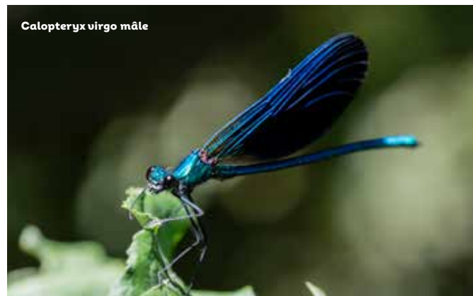
Calopteryx virgo mâle

Aujourd'hui, les berges permettent d'observer les innombrables dérivations, écluses et vannes qui ponctuent ces ruisseaux. Ces installations témoignent du système d'irrigation complexe mis en place pour alimenter les vergers et les cultures maraichères qui caractérisaient ces quartiers par le passé.