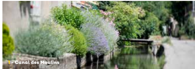
Canal des Moulins

Cette balade vous emmènera à la découverte du quartier Châteaupert où vous pourrez admirer les résurgences des eaux du Vercors, dont la fontaine des Malcontents, puis après avoir traversé la cour de la Fédération de la pêche vous arriverez aux jardins et aux zones humides protégées. Vous apprécierez la fraîcheur de cette balade bucolique et apercevrez une faune importante (grenouilles, libellules, truites) et une flore abondante (callitriches, potamots, rubanier).