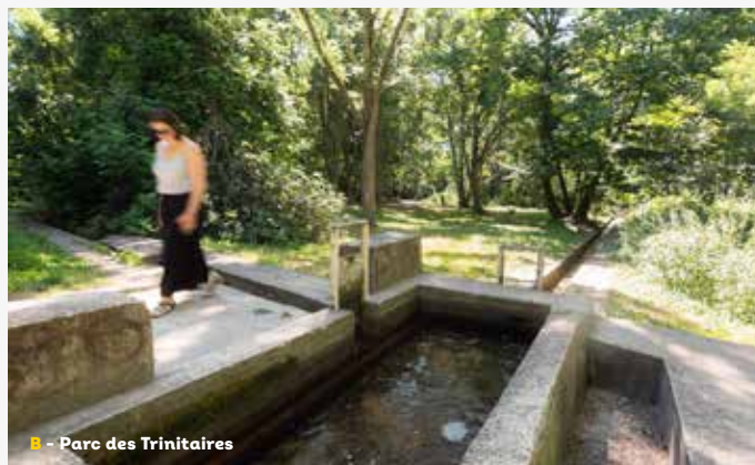
B - Parc des Trinitaires

Ne pas jeter sur la voie publique / © Cyril Crespeau / © Dominique Guillot / Impression : Impressions Modernes