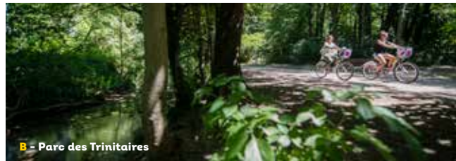
B - Parc des Trinitaires

Cette balade vous permettra de longer plusieurs canaux, mais aussi de relier 4 des principaux espaces naturels de la ville : cette coulée verte à travers les parcs Jovet, des Trinitaires, Marcel Paul et de l'Épervière, conduira vos pas jusqu'au port de plaisance. Vous apprécierez la vue depuis la marina sur la montagne ardéchoise. Le retour se fera en empruntant une portion de la ViaRhôna, cet itinéraire qui longe le Rhône entre le lac Léman et la Méditerranée.