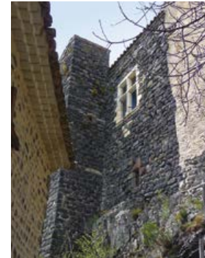
Dans les ruelles de Sceautres