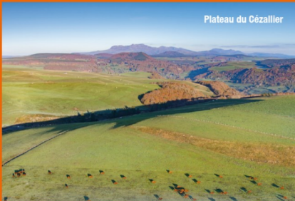
Plateau du Cézalier