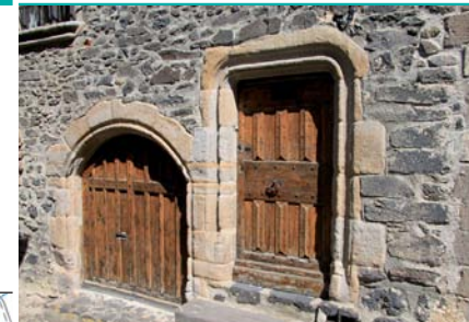
Portes dans le village de Lamothe.