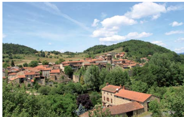
Le village de Lavaudieu.

ter la route sur 200 m le long des maisons. 5 À mi-pente, suivre un sentier sur la droite à travers bois. Remonter légèrement jusqu'à un autre chemin. 6 Pour suivre à droite et gagner les bords de la Senouire en dessous de Lavaudieu. Laisser le pont à droite et longer la rivière jusqu'au parking.