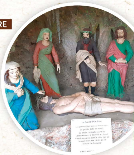
Le Saint Sépulcre Les personnages sont du Moyen Age. La croix date de 1910. La croix centrale vient de Jérusalem et a traversé du Saint Sépulcre, ainsi que le Christ qui fut enroulé dans les bras de la statue du Calvaire.

Dans une petite chapelle, vous trouverez une belle « mise au tombeau » en bois polychrome du XVII e siècle. Vous y verrez le Christ allongé et cinq personnages. En bleu, la Vierge Marie, une des Marie (peut-être Marie-Madeleine malgré le voile dans ses cheveux), Joseph d'Arimathie portant le linceul, Saint-Jean et Nicodème. La croix centrale du calvaire vient de Jérusalem.