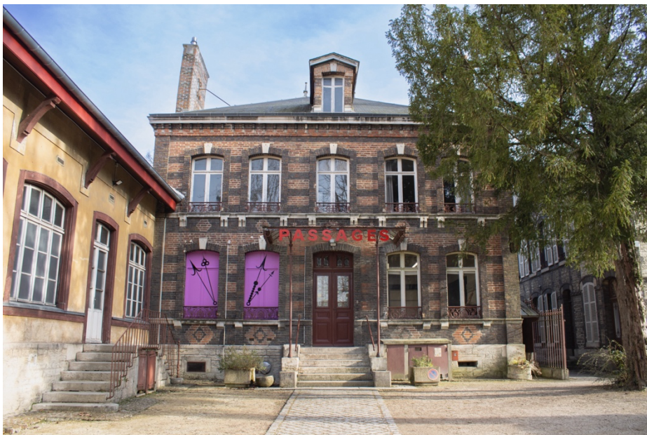
Passages, Centre d'Art Contemporain d'Intérêt National depuis le 20 janvier 2026.