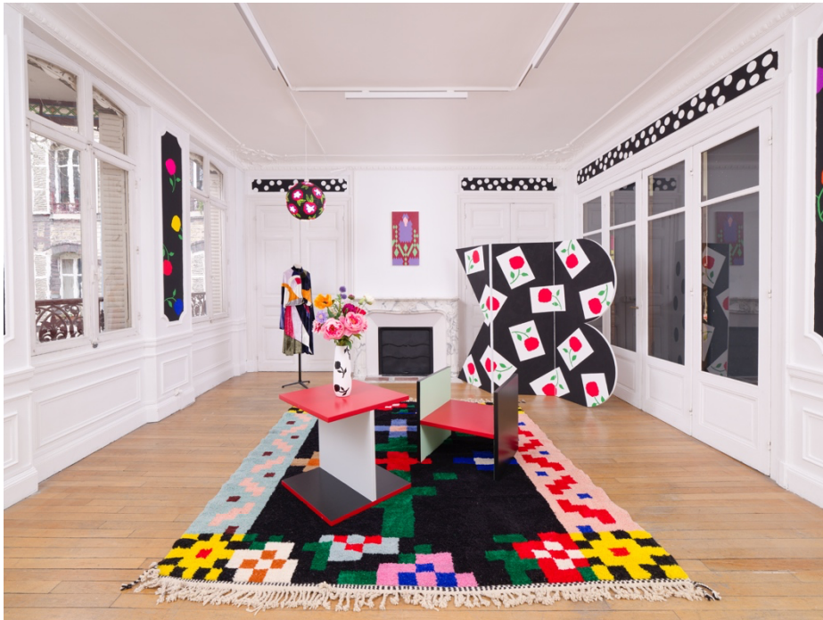
Casa Karina , vue d'exposition, Karina Bisch, jusqu'au 18 avril 2026. Crédit : Aurélien Mole. Courtesy : Karina Bisch et ADAGP 2026