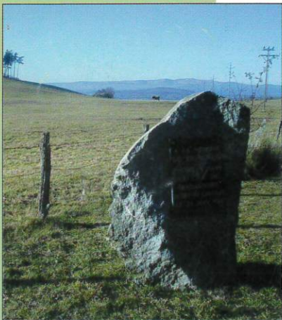
La stèle du lieutenant Monod