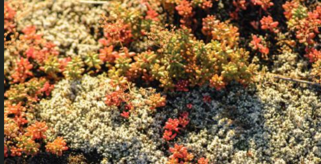
Les orpins, plante pionnière des milieux secs.