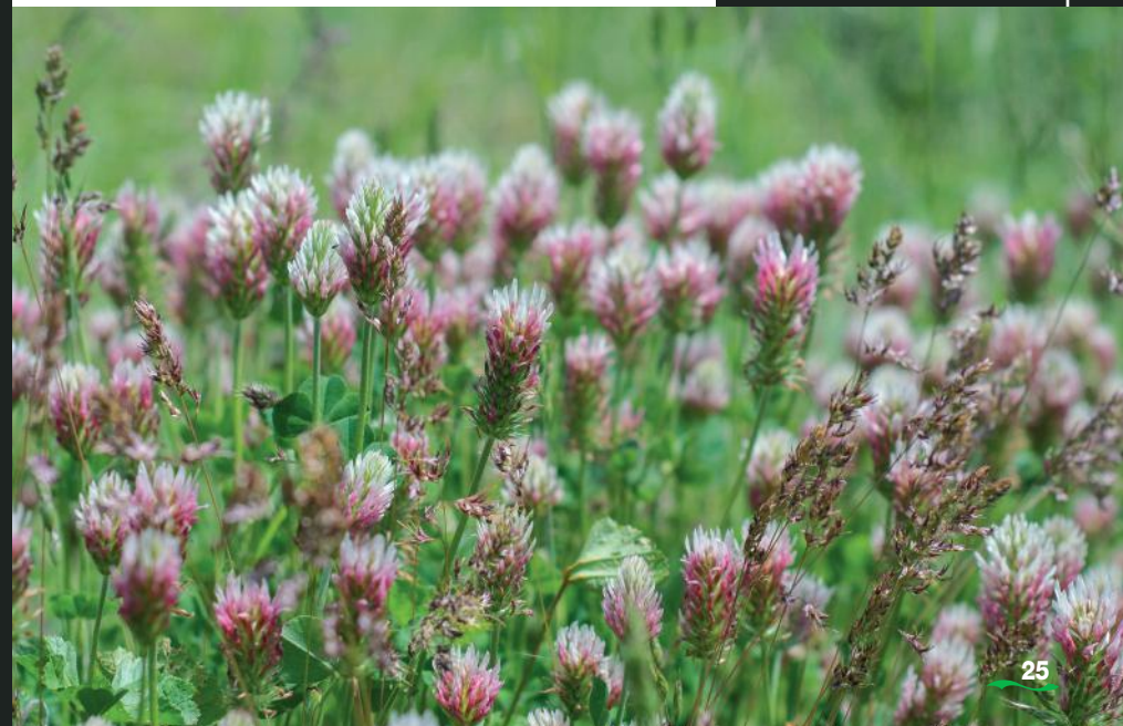
Trèfles en fleurs.

La richesse floristique des versants secs de l'Alagnon est depuis longtemps liée aux pratiques agricoles traditionnelles.