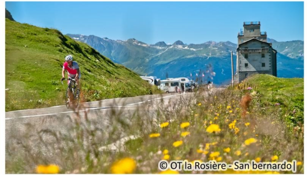
© OT la Rosière - San bernardo

Gravir un col de plus de 2000 mètres d'altitude à vélo, c'est pour aujourd'hui ! Grâce à sa pente modérée et régulière d'environ 5% en moyenne, vous pourrez accrocher le Petit-Saint-Bernard à votre palmarès. Et vous pourrez dire : je l'ai fait !