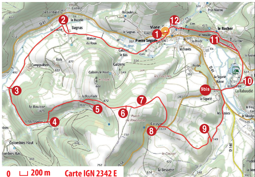
0 200 m Carte IGN 2342 E