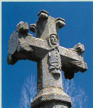
Croix dans le cimetière de Tiviers.

Forêts et pâturages, eaux vives et points de vue font le décor de cette balade qui fleure bon le pin sylvestre. Ici les paysages évoquent déjà plus la Margeride que la Planèze, et les basaltes cèdent la place aux gneiss et micaschistes dont sont faites les jolies fermes qui jalonnent le parcours. Quant aux champignons, la toponymie ne ment pas, ils poussent en abondance et l'on pourra en faire provision à Belvezet.