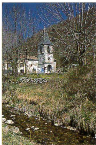
L'église de Tiviers et le ruisseau des Trompettes.

5 Prendre à droite ; laisser un embranchement à droite et descendre pour rejoindre Tiviers.